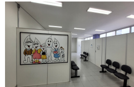
Sala de espera maior e exclusiva do serviço