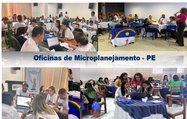
Figura 1- Registro fotográfico das Oficinas em Pernambuco, 2023

A queda das coberturas vacinais é uma questão de saúde pública, sendo um fenômeno multifatorial. Frente a este problema, o Ministério da Saúde (MS), os estados e os municípios vêm traçando diferentes estratégias de regaste de altas coberturas vacinais. O MS ofertou aos estados Oficinas de Microplanejamento (MP) para as Atividades de Vacinação de Alta Qualidade (Avaq) e formou 25 representantes de Pernambuco (PE) como facilitadores para replicar a estratégia nas Regionais e Municípios do estado. A Secretaria Estadual de Saúde de Pernambuco (SES-PE), por meio do Programa Estadual de Imunização (PEI), elaborou um cronograma de Oficinas Regionais de MP para as Avaq no estado.