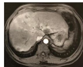
Figura 3. Ressonância Magnética.