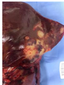
Figura 1. Nódulos em explante hepático.