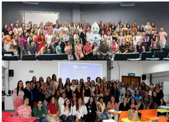
Evento de lançamento dos cursos nas cidades de Pau dos Ferros (RN) em 25/03/2024 e Salvador (BA) em 10/05/2024.

A qualificação dos profissionais da atenção primária pelo projeto resultou em um aumento médio de mais de 130% nos encaminhamentos, espera-se que iniciativas de busca ativa de usuários, idealizadas a partir da atividade final do curso, sejam ampliadas, aumentando o impacto da ação educacional.